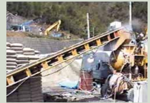
落下による発塵状況の違い