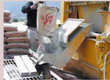
普通品使用の場合

ナイダスト ® は、普通セメントと同等の性質を示しているため、普通セメントと同じ用途に使用可能です。汎用のセメントに比べ発塵量を大幅に抑えている為、周辺環境の保全や作業環境改善はもちろんのこと、作業の安全性向上や、作業従事者の健康維持にも有効です。 たとえば、左官用モルタル、既製杭のセメントミルク注入工法など、粉塵を嫌う市街地や商店街などで施工する場合その効果を発揮します。